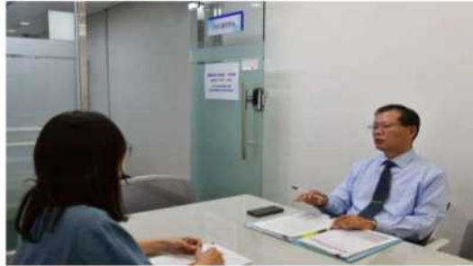
서울 노원구 구민고충처리위원회가 한 주민의 고충민원을 상담하고 있다.

이성희 기자 mong2@kyunghyang.com 2023.10.17 10:57